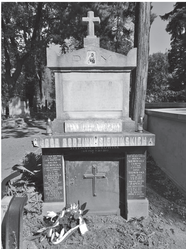
Zabytkowy grobowiec rodziny Siemińskich, znajdujący się na Cmentarzu Rakowickim w Krakowie